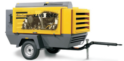
整机结构紧凑，操作简单便捷