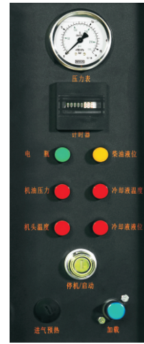
继电器控制系统，稳定、可靠